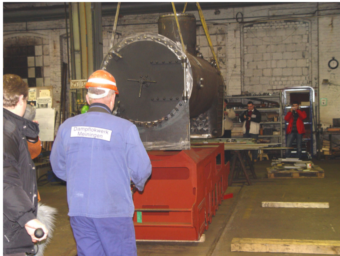
Die „Hochzeit“ von Kessel und Rahmen