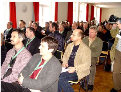
Gespannte Erwartung im Konferenzraum des DLW Meiningen