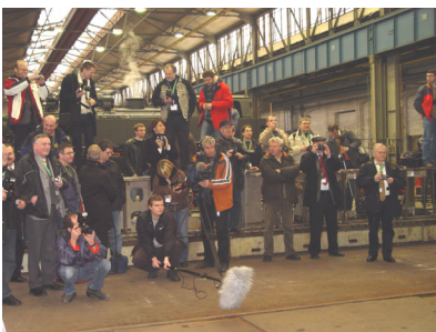
Und das Ganze vor den Objektiven der versammelten Weltpresse