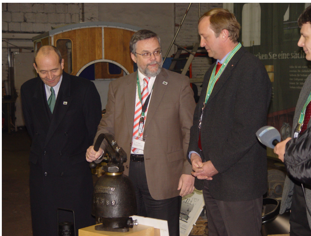
Die Endmontage wird eingeläutet