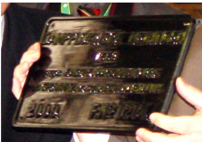
Das Fabrikschild (Die I K trägt die Fabriknummer 204)