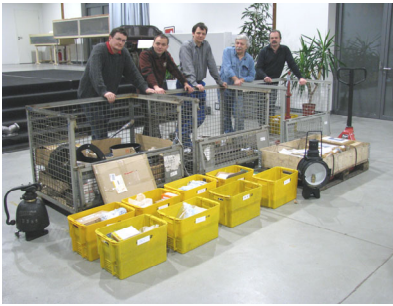
Vorm Abtransport: jedes Teil - gezählt, geprüft, verpackt