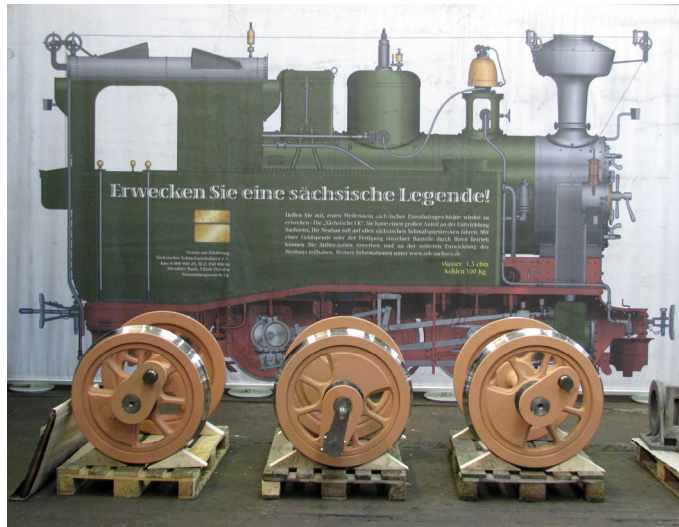
„Als würde sie gleich losfahren ...“