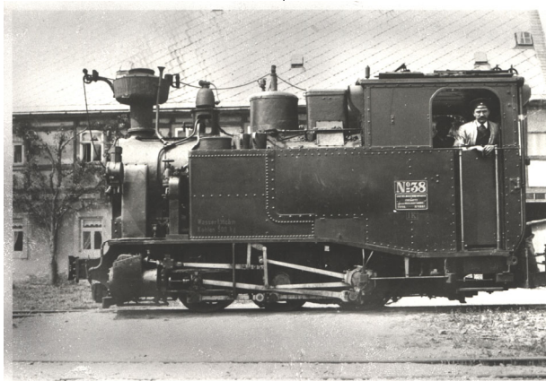
IK in Dippoldiswalde (um 1890, Sammlg. D. Teichmann)

Anfang 1882 lieferte die SMF eine vierte, ebenfalls bereits 1881 gebaute I K für die Linie Wilkau – Kirchberg.