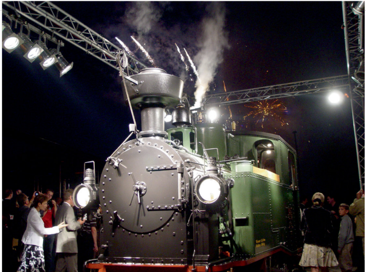
Die I K Nr. 54 bei ihrer offiziellen Inbetriebnahme am 04. Juli 2009 in Radebeul.

Es gibt Momente und Dinge im Leben, bei denen man die Zeit vergessen könnte. Exakt so verhält es sich ganz sicher beim „Wunder aus Sachsen“ – der I K Nr. 54. Ein Jahr ist es inzwischen her, dass diese Lokomotive nach rund dreijähriger Bauzeit in Dienst gestellt werden konnte. Schon ein Jahr her? Man hat die Zeit gar nicht bemerkt, derart stark ist die unvergessliche I K-Willkommenstour im Juni und Juli 2009 im Gedächtnis geblieben. Indes: Innerhalb dieses einen Jahres zwischen Sommer 2009 und Sommer 2010 hat die I K Nr. 54 inzwischen hunderte Schmalspurzüge befördert, tausende begeisterte Fahrgäste befördert, sie ist durch Städte und Gemeinden mit mehreren zigtausenden Ein-