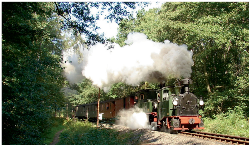
Die I K Nr. 54 im Juni 2010 auf der Döllnitzbahn zwischen Oschatz und Mügeln (oben), sowie Anfang September 2010 im Zittauer Gebirge (Aufnahme unten).

Schauen Sie doch einmal im Netz vorbei: www.dampfbahn-route.de . Hier finden Sie noch viele weitere interessante Informationen zur I K Nr. 54 und zu Sachsen als lohnenswertem Reiseziel. Ein herzliches Glück auf!