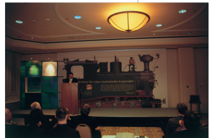
Im Jahr 2005 reifte die Idee zum Neubau der I K Nr. 54, im Januar 2006 wurde das Projekt in Dresden der Öffentlichkeit vorgestellt.

ger, doch im Jahr 2005 konkretisierte sich das Vorhaben. Anlässlich des großen Jubiläums „125 Jahre Schmalspurbahnen in Sachsen“ präsentierte der Verein zur Förderung Sächsischer Schmalspurbahnen e.V. (VSSB) das Projekt im Januar 2006 der Öffentlichkeit in Dresden. Das Echo auf diesen „Master-Plan“ war gewaltig. Viel, viel Begeisterung kam sofort auf – aber auch Skepsis, ob der Neubau einer 125 Jahre alten Dampflokkonstruktion im 21. Jahrhundert funktionieren könnte – unter Beachtung aller technischen und finanziellen Schwierigkeiten. Doch einen klareren Sieg der Begeisterung über die Skepsis hätte es kaum geben können. Der Bau der I K Nr. 54 wurde ausschließlich über unzählige kleine und große Geldspenden aus Sachsen, aus ganz Deutschland und sogar aus dem Ausland finanziert. Öffentliche Mittel kamen nicht zum Einsatz. Den Bau